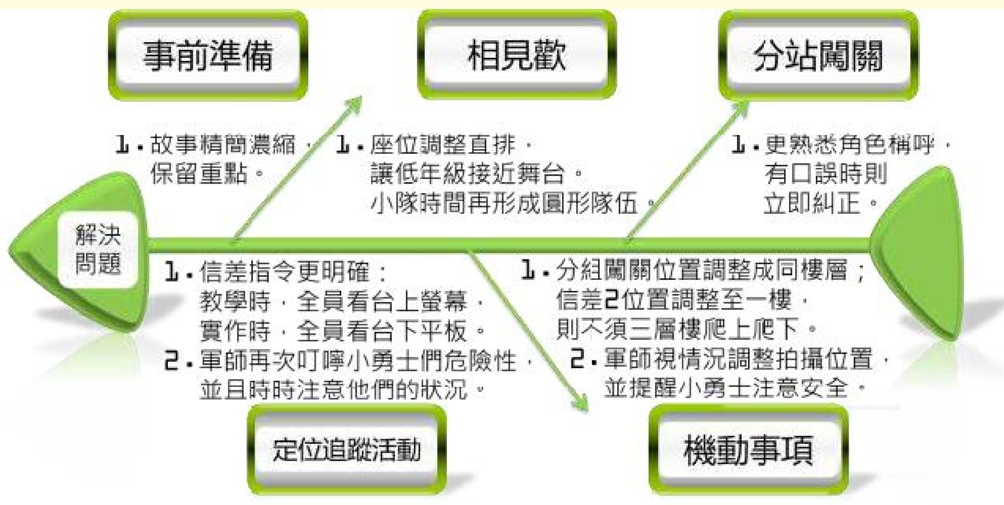
定位追蹤活動集思廣益的改善策略